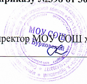
График питания в школьной столовой Школы х. Закутский